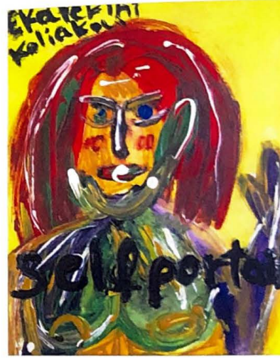
Self Portrait / Otoporre, 100cm x 50cm, Açıklik on canvas