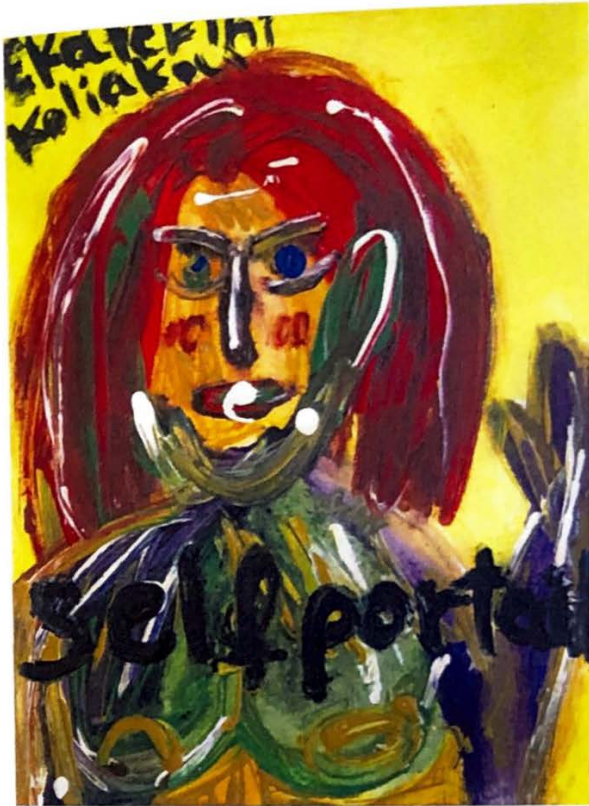
Self Portrait / Otoportre, 30cm x 50cm, Acrylic on canvas