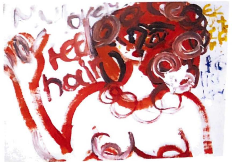
Self Portrait / Otoportre, 50cm x 70cm, Acrylic on canvas