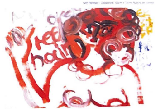
Self Portrait / Otoporre, 100cm x 50cm, Açıklik on canvas